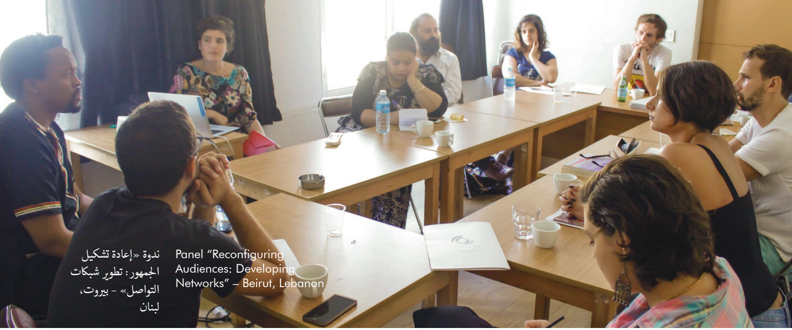
ندوة «إعادة تشكيل الجمهور: تطوير شبكات التواصل» - بيروت، لبنان Panel "Reconfiguring Audiences: Developing Networks" - Beirut, Lebanon