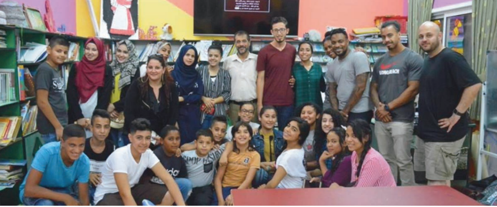
ورشة إخراج سينمائي - نابلس، فلسطين Filmmaking workshop – Nablus, Palestine